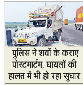
पुलिस ने शवों के कराए पोस्टमार्टम, घायलों की हालत में भी हो रहा सुधार

केएमपी एक्सप्रेस-वे पर दर्दनाक हादसे में जान गंवाने वाले मृतकों के शवों का पुलिस ने वीरवार को पोस्टमार्टम करा दिया। गमगीन माहौल में परिजन शवों को अपने गांव ले गए। वहीं पीजीआई में भर्ती घायलों की हालत में भी सुधार हो रहा है। दरअसल, मजदूरों से भरी पिकअप गाड़ी उत्तर प्रदेश से महेंद्रगढ़ जा रही थी। बुधवार की अल सुबह करीब तीन बजे गाड़ी जसोर खेड़ी के पास केएमपी पर रास्ता पछुने के लिए रोकी गई थी। इस दौरान एक अन्य ट्रक चालक