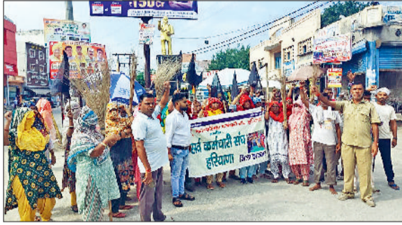
झज्जर। अंबेडकर चौक पर झाड़ू व काले झंडों के साथ विरोध प्रदर्शन करते नगर परिषद के सफाई कर्मचारी।