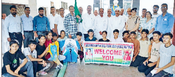
इज्जर। शूटिंग बॉल एसोसिएशन सदस्यों के साथ उपस्थित शूटिंग बॉल टीम के खिलाड़ी।