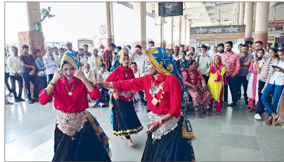
झज्जर। बस स्टैंड पर नाटक की प्रस्तुति देते हुए टीम के सदस्य।