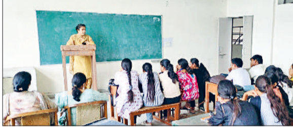
इज्जर। प्रतियोगिता में अपने विचार प्रस्तुत करते हुए प्रतिभागी छात्रा।