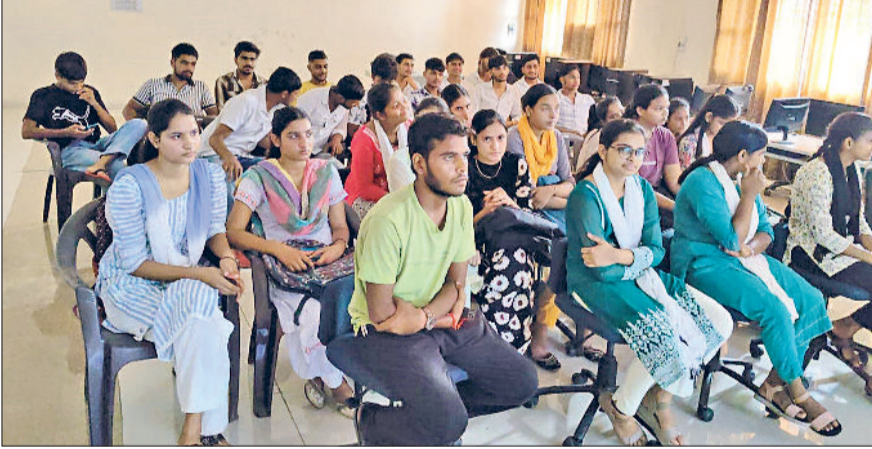
बहादुरगढ़। व्याख्यान के दौरान उपस्थित विद्यार्थी।

प्राचार्य डॉ. अनीता दलाल ने विद्यार्थियों को नया व्यवसाय शुरू करने और विभिन्न कौशल विकसित करने के लिए प्रेरित