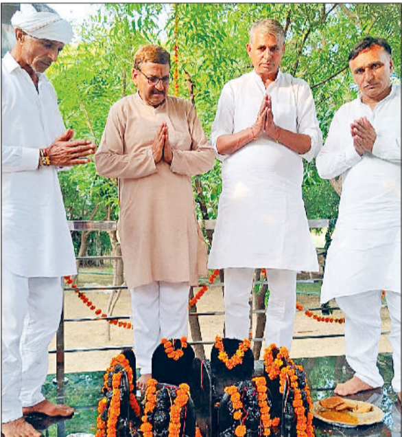
बहादुरगढ़। प्राण प्रतिष्ठा के बाद पूजा अर्चना करते ग्रामीण।