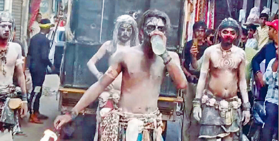
झज्जर। शोभायात्रा में अघोरी बाबाओं की झांकी रही आकर्षण का केंद्र।