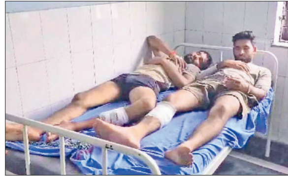
बहादुरगढ़। अस्पताल में उपचारधीन बदमाश।