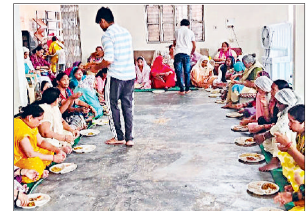
बहादुरगढ़। भंडारे में प्रसाद ग्रहण करती संगत।

आयोजक समिति प्रवक्ता ने बताया कि कार्यक्रम के दूसरे दिन धर्म प्रचार के अंतर्गत जहां स्वामी उमानंद के प्रचन होंगे वहीं शनिवार को तरंग उत्सव कार्यक्रम के अंतर्गत संध्या सितारा भगवान कृष्ण के भजनों की मधुर प्रस्तुति देंगे।