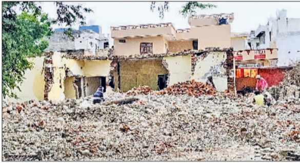
बहादुरगढ़। पीडब्ल्यूडी बीएंडआर कार्यालय के भवन को तोड़ते श्रमिक।