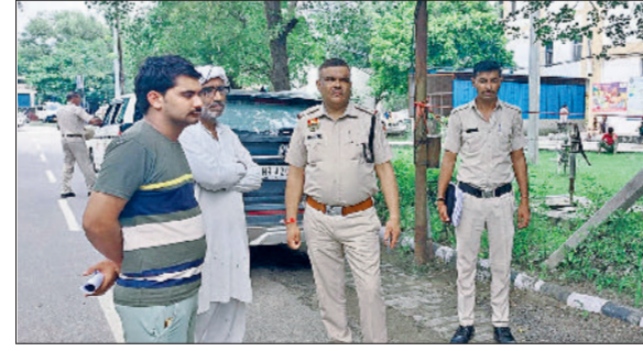
झज्जर। गुरुवार को पोस्टमार्टम के दौरान अस्पताल परिसर में उपस्थित परिजन एवं पुलिसकर्मी।